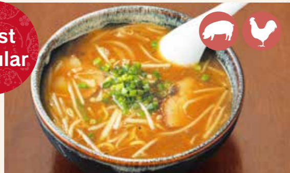
01 Miso Ramen 味噌らーめん ¥850