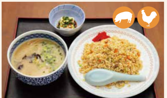
11 小份炒饭套餐 小份炒飯套餐 구미 미니 세트 ¥900