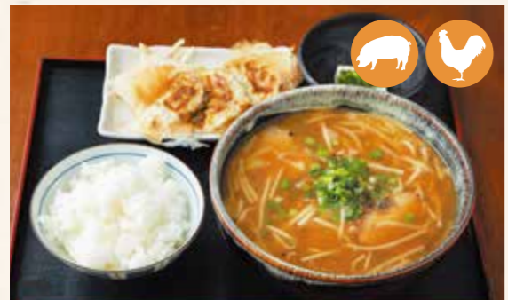
08 味噌套餐 味噌套餐 미소세트 (된장 세트) ¥1,200

使用了两种猪肉馅、国产蒜、生姜、韭菜和很多蔬菜，馅料十足。 使用了兩種豬肉餡、國產蒜、生薑、韭菜和很多蔬菜，餡料十足。 다진 돼지 고기 2종류, 국산 마늘, 생강, 부추, 야채를 듬뿍 사용해 건더기가 많습니다. 豚ミンチ 2種類、国産にんにく、生姜、ニラ、野菜をたっぷり使い具だくさんです。