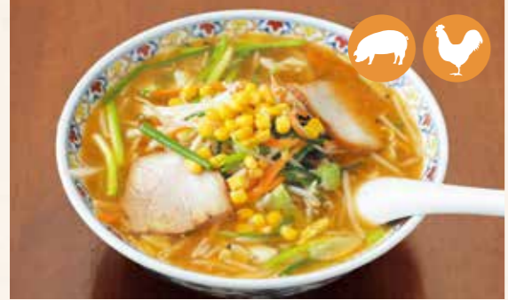
04 蔬菜味噌拉面 野菜味噌らーめん 蔬菜味噌拉麵 야채 미소 라면 (야채 된장 라면) ¥950