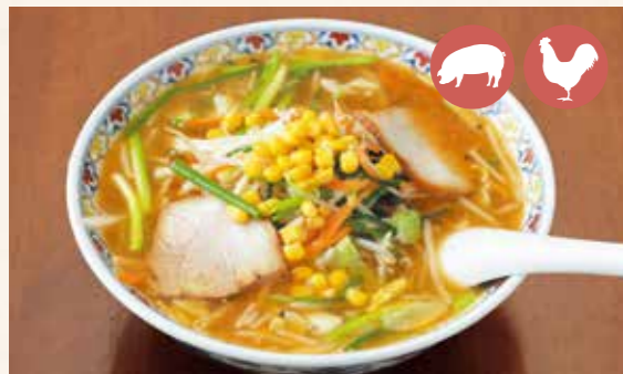
04 Various vegetables with Miso Ramen 野菜味噌らーめん ¥950