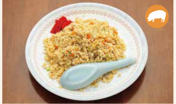
06 炒饭 炒飯 볶음밥 焼めし ¥600