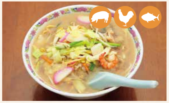
02 烩菜面条 烩菜麵條 장뽕 짜면 ¥850