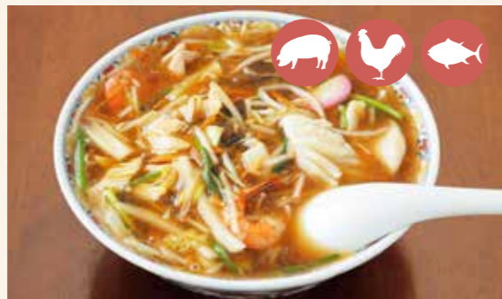
05 Sanma-Men (ramen with pork, various vegetables) さんまー麺 ¥950