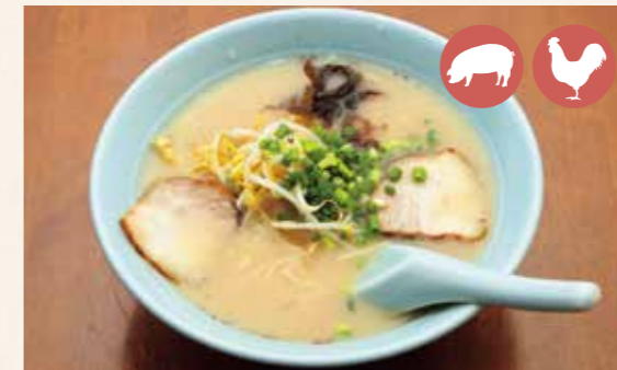
03 Tonkotsu (pork bone broth) Ramen 豚骨らーめん ¥800