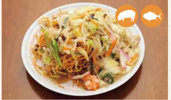
07 酥脆什锦炒面 酥脆什錦炒麵 바삭 바삭 야키소바 ¥950