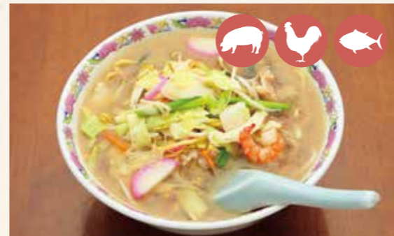
02 Chanpon (noodles with various vegetables in pork bones soup) ちゃんぽん ¥850