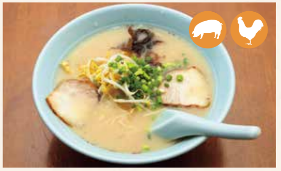
03 猪骨拉面 猪骨拉麵 돈코츠 라면 (돼지 사골 국물 라면) ¥800