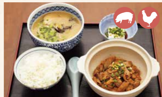
10 Horumonyaki (offal of meat) set ホルモンセット ¥1,100