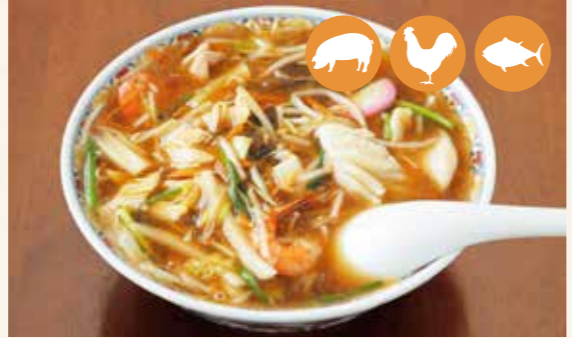
05 SANMA面 (是一种汤汁粘稠的蔬菜面) 日式蔬菜羹式拉麵 さんまー麵 삼마면 (중화베이스 간장면) ¥950