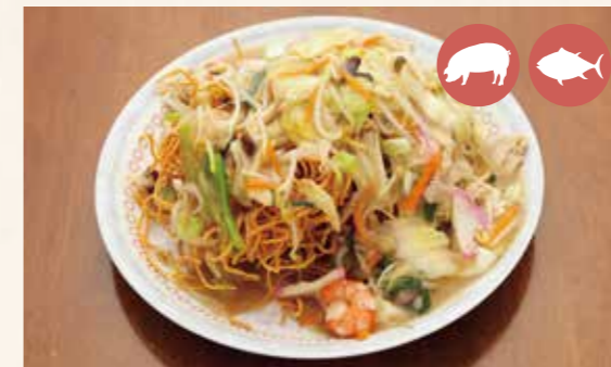
07 Paripari Yakisoba (Crispy fried noodles with sauce on top) バリバリ焼きそば ¥950