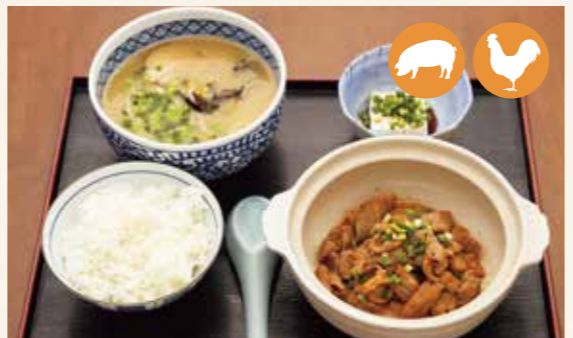
10 牛内脏套餐 牛內臟套餐 호르몬 세트 ¥1,100

热腾腾的汤里有手捏而制的馄饨。 熱騰騰的湯里有手捏而製的餛飩。 뜨거운 육수에 손으로 만든 완탕이 들어 있습니다. 熱々のスープの中には手づくりのワンタンが入っています。