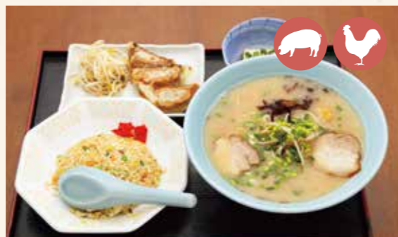
09 Ramen set らーめんセット ¥1,200