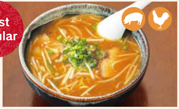
01 味噌拉面 味噌らーめん 味噌拉麵 미소라면 (된장 라면) ¥850