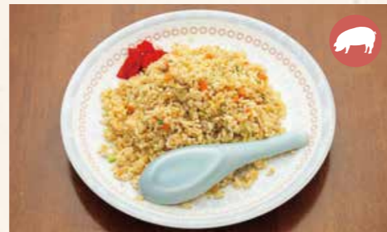
06 Fried rice 焼めし ¥600