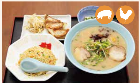
09 拉面套餐 拉麵套餐 라면세트 ¥1,200

使用了各种新鲜的蔬菜，营养丰富。 使用了各種新鮮的蔬菜，營養十足。 신선한 야채를 듬뿍 사용한 영양 만점 요리입니다. 新鮮野菜をたっぷり使った栄養満点料理です。