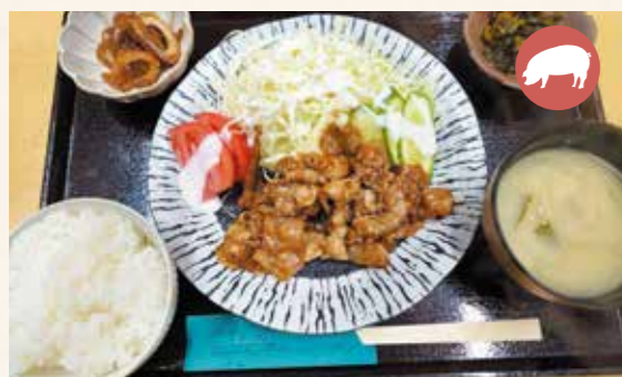
Order Number 04 Pork fried with ginger set meal 豚のしょうが焼定食 ¥1,300