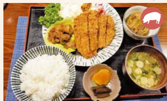
Order Number 06 Miso-flavored deep fried pork set meal 味噌カツ定食 ¥1,300