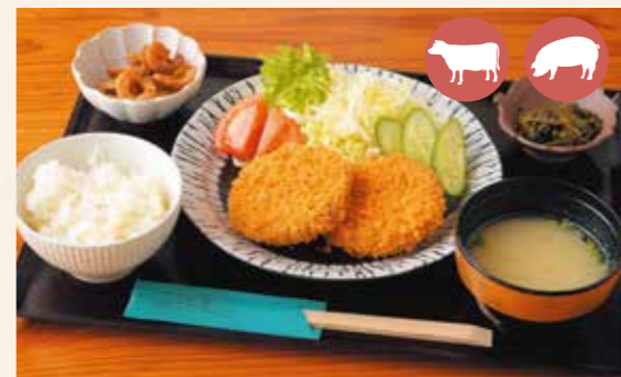
Order Number 03 Menchi-katsu (breaded and fried minced beef) set meal メンチカツ定食 ¥1,100