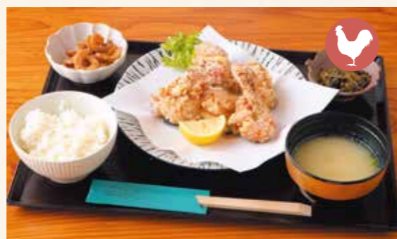
Order Number 05 Fried chicken set meal 鶏の唐揚げ定食 ¥1,300