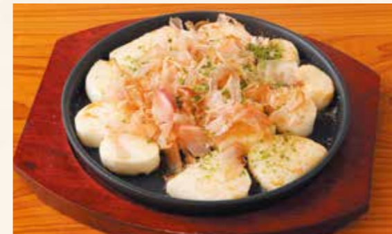
07 輪切山芋鉄板 山芋輪切鉄板 참마 등글게선 철판구이 山芋を鉄板で焼き上げました。 山芋を鉄板で焼き上げました。 ¥600