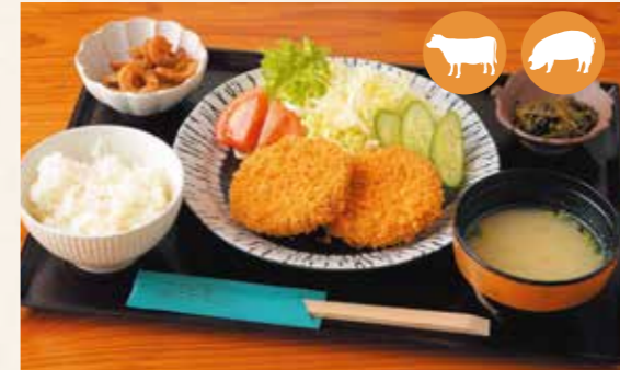
03 香炸肉餅定食 炸肉餅定食 멘치카츠 정식 メンチカツ定食 ¥1,100