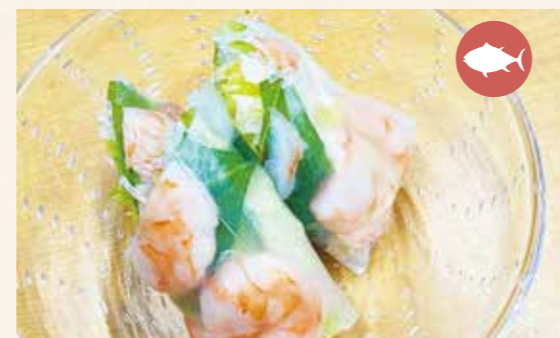
Order Number 10 Fresh spring rolls (Fresh spring rolls with plenty of vegetables and shrimps) 生春巻 (たっぷり野菜とえびの生春巻) 1本 ¥200

The crunchy lettuce matches the crumbly rice, very delicious. シャキシャキのレタスがパラパラのごはんとマッチして、とてもおいしいです。