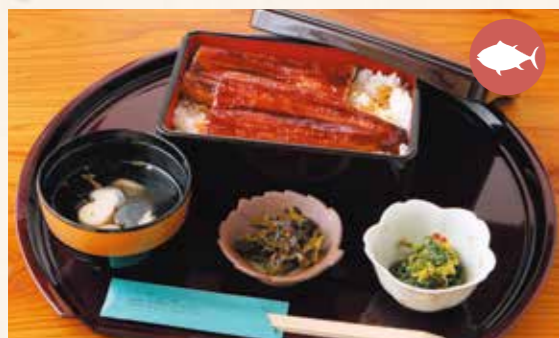
Order Number 08 Eel rice box (with soup and side dish) 鰻重(吸物と小鉢付) ¥2,800