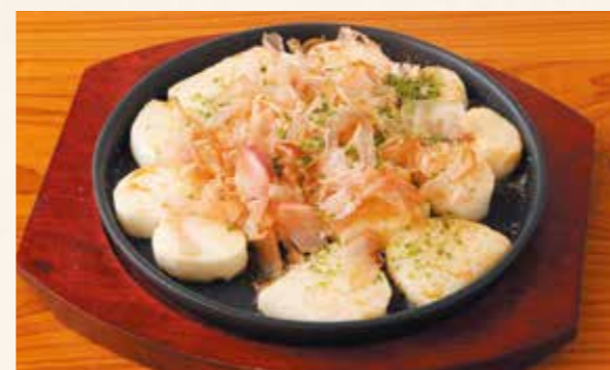
Order Number 07 Sliced yam teppan Yam with a fragrant aroma grilled on the iron plate. 山芋輪切鉄板 (香ばしい香りを楽しめる山芋を鉄板で焼き上げました。) ¥600