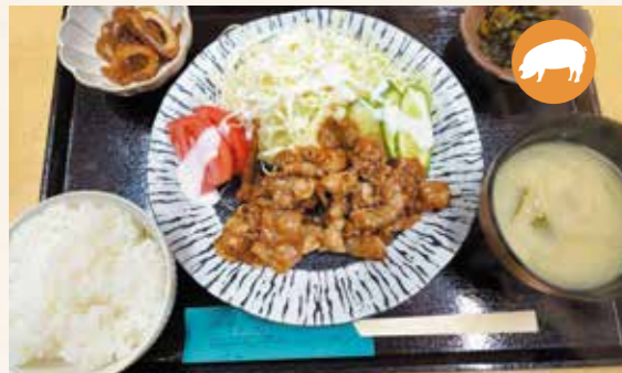
04 姜燒豬肉定食 豬薑燒定食 돼지고기 생강구이 정식 豚のしょうが焼定食 ¥1,300