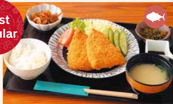
Order Number 01 Fried horse mackerel set meal アジフライ定食 ¥1,100