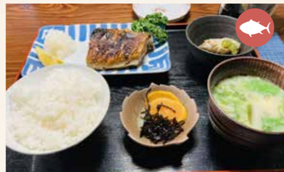
Order Number 02 Salted mackerel set meal 塩サバ定食 ¥1,100